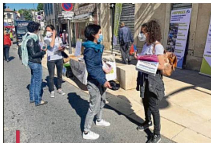
350 questionnaires ont déjà été remplis, dont une centaine sur le marché d'Istres.

Un supplément gratuit de "La Provence" est distribué lors des rendez-vous de "Réponses". Il est aussi consultable en ligne gratuitement sur www.dispositif-reponses.org