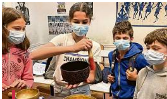
La méditation musicale était notamment au programme de cette parenthèse dédiée au bien-être au collège Matraja.

À l'arrivée, mission accomplie et bien-être général. Petits et grands ont eu l'impression d'avoir vécu une tranche de vie improbable dans ce contexte sanitaire.