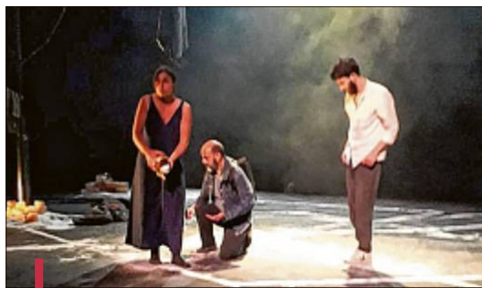
La compagnie Demesten Titip a présenté "Le sel", sa dernière création, pendant sa résidence.

Les retrouvailles ont lieu aujourd'hui à 19 heures avec la compagnie "Du Jour au lendemain" et son dernier spectacle "La dispute" d'Agnès Régolo, qui pour l'occasion a revisité la fable intemporelle de Marivaux en une version rythmée. Un atelier de pratique avec la metteuse en scène aura lieu dimanche 6 juin de 10 h à 16 h 30. www.theatre-semaphore-portdebouc.com/